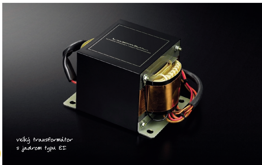
veľký transformátor s jadrom typu EI