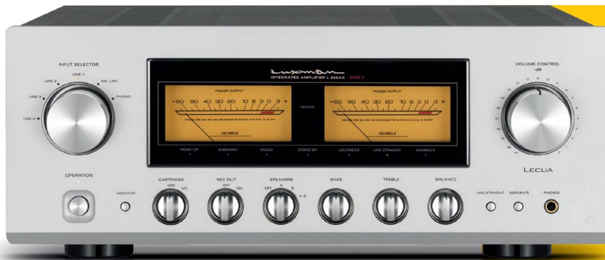
AUTOR MIROSLAV MAGLEN