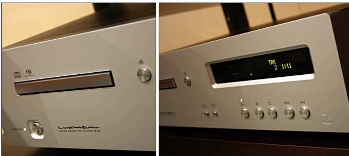
Luxusní kovová mechanika s tichým, přesným i když ne úplně rychlým chodem (což je pro SACD mechaniky typické). Displej je dostatečně velký, dostatečně přehledný a dostatečně kontrastní, velká tlačítka jsou skvělá.

Merit věci, hlavní předmět zájmu, jádro pudla (chcete-li), totiž player Luxman D-05 jsem v tom prvotním návalu podnětů musel trochu hledat. Úhledný, technicky krásný přístroj, s několika málo tlačítky a relativně malým displejem utopeným v masivním čelním panelu, na sebe nijak zvlášť neupozorňuje. Ale mohl by, zasloužil by si více pozornosti. Já si tohoto komponentu vlastně všiml jen když jsem hledal šuplík mechaniky pro vkládání disků, jinak jsem mimoděk doslova vzhlížel k zesilovači L-550A II... Nicméně i přesto jsem podvědomě nijak nezapochoyboval o kvalitách D-05.